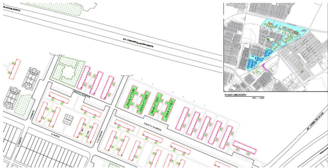
Imagen referencial de la zona a intervenir.