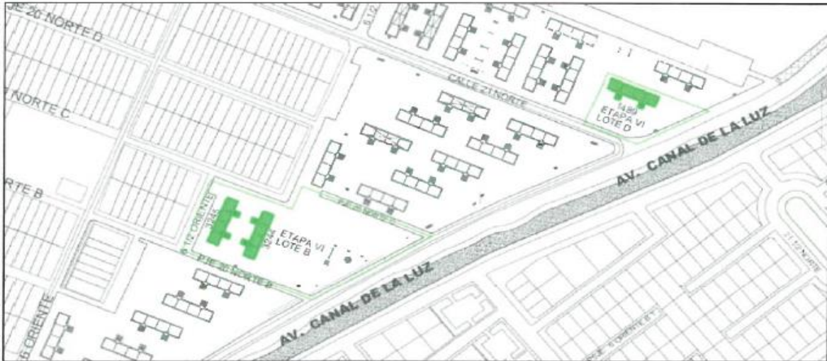
Imagen referencial de la zona a intervenir.

Block N°3244, etapa VI lote B Block N°3545, etapa VI lote B Block N°1489, etapa VI lote D