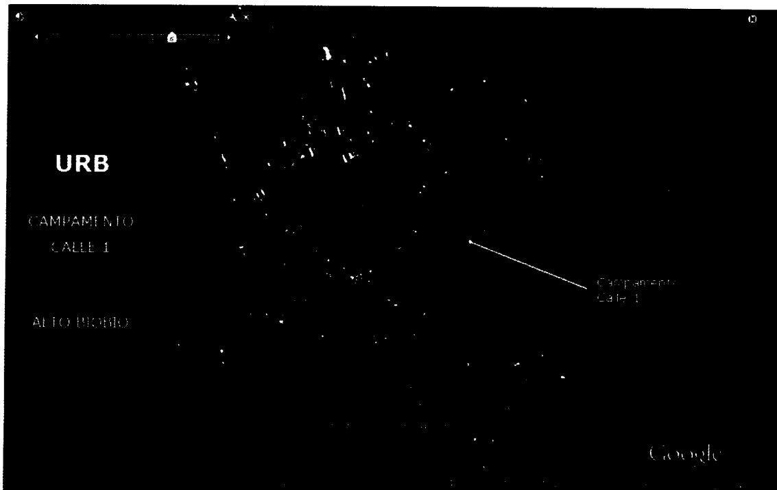
Imagen 1: Polígono Campamento Calle 1.

En consecuencia, atendido el común interés de la SEREMI y de la MUNICIPALIDAD por desarrollar las actividades señaladas en el párrafo antecedente; y considerando que el presupuesto del MINVU, Programa de Aldeas y Campamentos, contempla la posibilidad de transferencias de capital a otras entidades públicas, específicamente a Municipalidades (subtítulo 33 ítem 03 asignación 003 del presupuesto vigente), se estima necesaria la celebración de un convenio de ejecución y transferencia de recursos, en virtud del cual, la MUNICIPALIDAD podrá disponer de los fondos necesarios para financiar el proyecto denominado “DISEÑO Y CONSTRUCCIÓN URBANIZACIÓN CAMPAMENTO CALLE 1, COMUNA DE ALTO BIO BIO, REGIÓN DEL BIO BIO” .