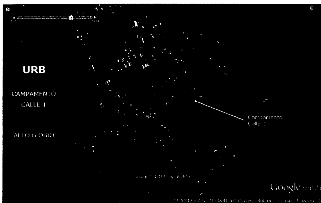
Imagen 1: Polígono Campamento Calle 1.

En consecuencia, atendido el común interés de la SEREMI y de la MUNICIPALIDAD por desarrollar las actividades señaladas en el párrafo antecedente; y considerando que el presupuesto del MINVU, Programa de Aldeas y Campamentos, contempla la posibilidad de transferencias de capital a otras entidades públicas, específicamente a Municipalidades (subtítulo 33 ítem 03 asignación 003 del presupuesto vigente), se estima necesaria la celebración de un convenio de ejecución y transferencia de recursos, en virtud del cual, la MUNICIPALIDAD podrá disponer de los fondos necesarios para financiar el proyecto denominado “DISEÑO Y CONSTRUCCIÓN URBANIZACIÓN CAMPAMENTO CALLE 1, COMUNA DE ALTO BIO BIO, REGIÓN DEL BIO BIO” .