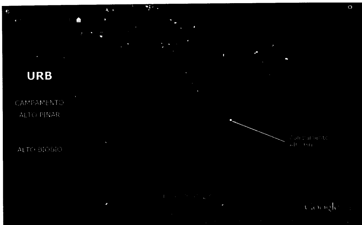
Imagen 1: Polígono Campamento Alto Pinar.

En consecuencia, atendido el común interés de la SEREMI y de la MUNICIPALIDAD por desarrollar las actividades señaladas en el párrafo antecedente; y considerando que el presupuesto del MINVU, Programa de Aldeas y Campamentos, contempla la posibilidad de transferencias de capital a otras entidades públicas, específicamente a Municipalidades (subtítulo 33 ítem 03 asignación 003 del presupuesto vigente), se estima necesaria la celebración de un convenio de ejecución y transferencia de recursos, en virtud del cual, la MUNICIPALIDAD podrá disponer de los fondos necesarios para financiar el proyecto denominado “DISEÑO Y CONSTRUCCIÓN URBANIZACIÓN CAMPAMENTO ALTO PINAR, COMUNA DE ALTO BIO BIO, REGIÓN DEL BIO BIO” .