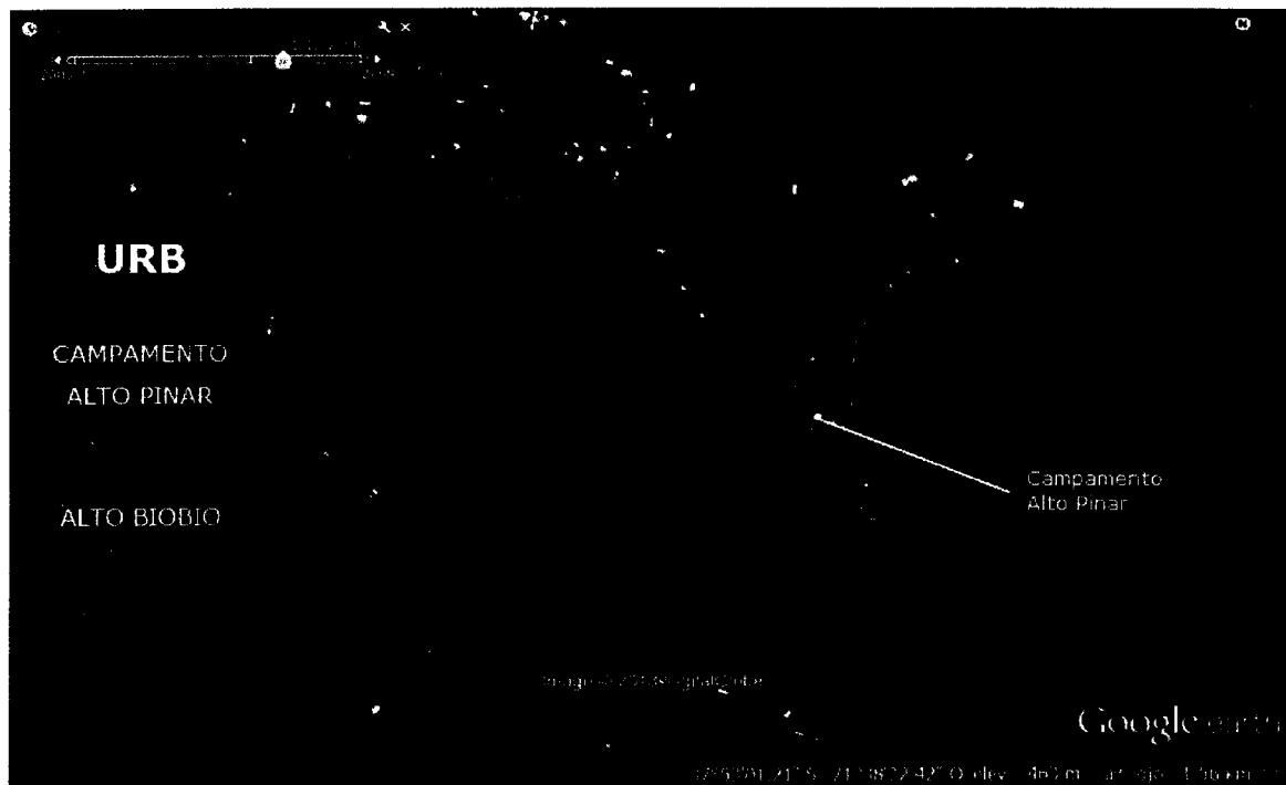
Imagen 1: Polígono Campamento Alto Pinar.

En consecuencia, atendido el común interés de la SEREMI y de la MUNICIPALIDAD por desarrollar las actividades señaladas en el párrafo antecedente; y considerando que el presupuesto del MINVU, Programa de Aldeas y Campamentos, contempla la posibilidad de transferencias de capital a otras entidades públicas, específicamente a Municipalidades (subtítulo 33 ítem 03 asignación 003 del presupuesto vigente), se estima necesaria la celebración de un convenio de ejecución y transferencia de recursos, en virtud del cual, la MUNICIPALIDAD podrá disponer de los fondos necesarios para financiar el proyecto denominado “DISEÑO Y CONSTRUCCIÓN URBANIZACIÓN CAMPAMENTO ALTO PINAR, COMUNA DE ALTO BIO BIO, REGIÓN DEL BIO BIO” . La transferencia de recursos para el financiamiento de dicho proyecto, fue informada mediante ficha de proyecto suscrita por Sr. Alcalde de la I. Municipalidad de Alto Bio Bio y el Director de Planificación, con fecha 10 de mayo de 2013, que se adjuntan y que se entiende forman parte integrante del presente convenio.