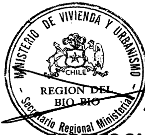
RODRIGO SAAVEDRA BURGOS SEREMI VIVIENDA Y URBANISMO REGIÓN DEL BIOBIO