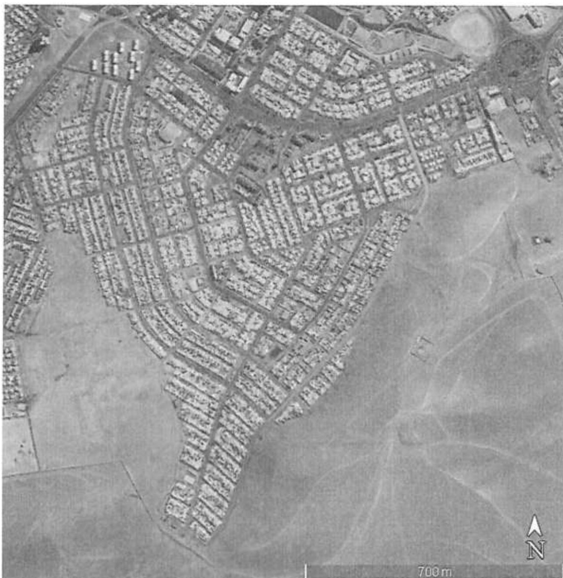
Imagen: Planta General de Vía a Intervenir