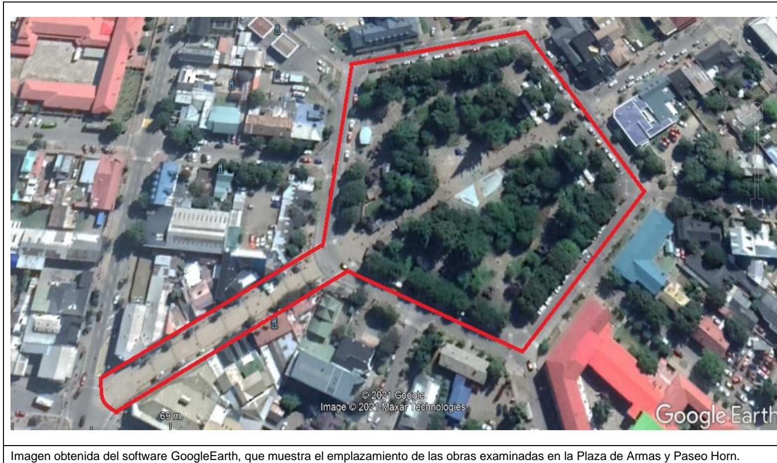
Imagen obtenida del software GoogleEarth, que muestra el emplazamiento de las obras examinadas en la Plaza de Armas y Paseo Horn.