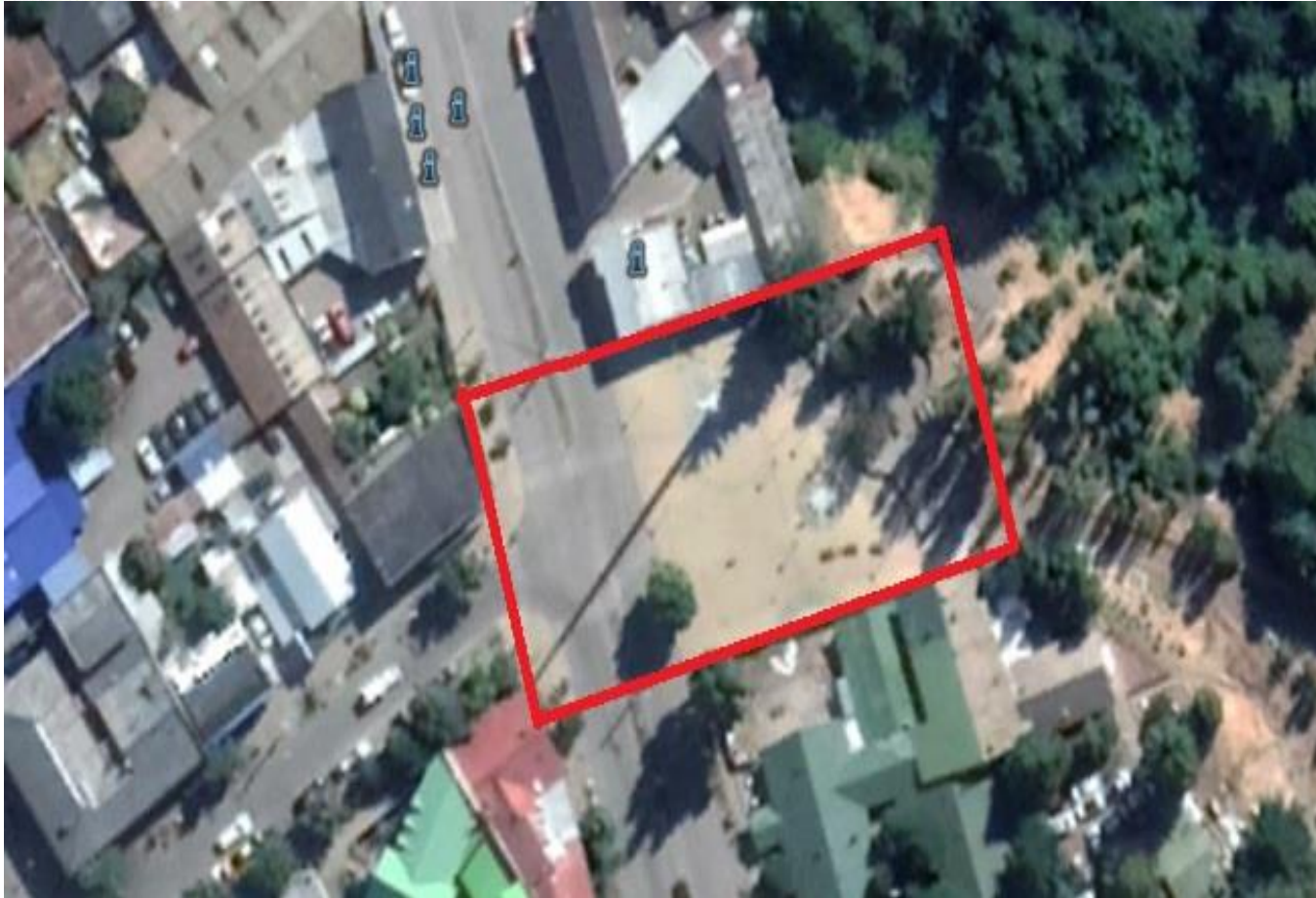
Imagen obtenida del software GoogleEarth, que muestra el emplazamiento de las obras examinadas en la Plaza Bicentenario - Plaza de las Banderas-.

POR EL CUIDADO Y BUEN USO DE LOS RECURSOS PÚBLICOS