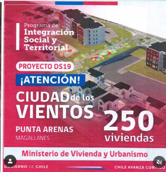
Imágenes de la actividad y afiche publicado en Diario y Redes Sociales.

G) En el marco del Plan de Emergencia Habitacional Punta Arenas, y respecto a terrenos de propiedad de SERVIU Magallanes utilizables para llevar a cabo este Plan, se regulariza la situación del terreno ubicado en Av. Martínez de Aldunate N°LT1 A1-B3, para lo cual se realiza un ingreso en DOM Punta Arenas para solicitar una modificación de deslindes del presente terreno, para lo cual se realizan las siguientes actividades: