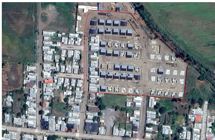
Figura N°1, emplazamiento de lotes del proyecto habitacional

El conjunto habitacional, emplazado en un terreno de 22.288 m 2 , se compone de un total de 60 viviendas, distribuidas en 2 tipologías: