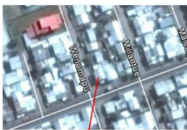
Ubicación de la vivienda por postulante