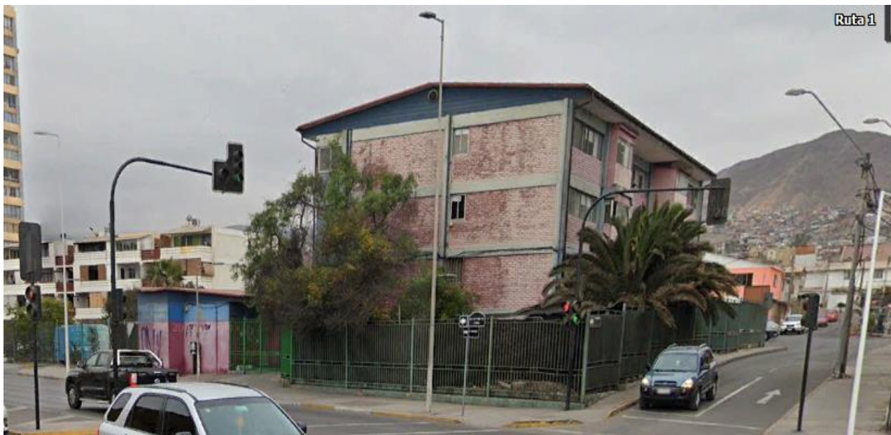
Fig. N° 8: Imagen referencial Fachada Poniente

Exteriormente, considera el área verde, jardineras, palmeras, árboles, cierre de placas, garita, zona de estacionamientos, esta última pavimentada con asfalto y cualquier otra construcción o especie vegetal que se encuentre dentro de este terreno (ejemplo estación de monitoreo). El área por intervenir en esta demolición abarca todo lo que existen dentro del polígono Fig. N° 2: Superficie de terreno y de Edificio. El alcance del contrato finalmente es entregar un terreno totalmente despejado. Lo único que no se retira es la reja existente perimetral.