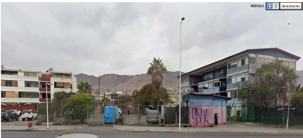
Fig. N° 10: Imagen referencial Fachada Poniente