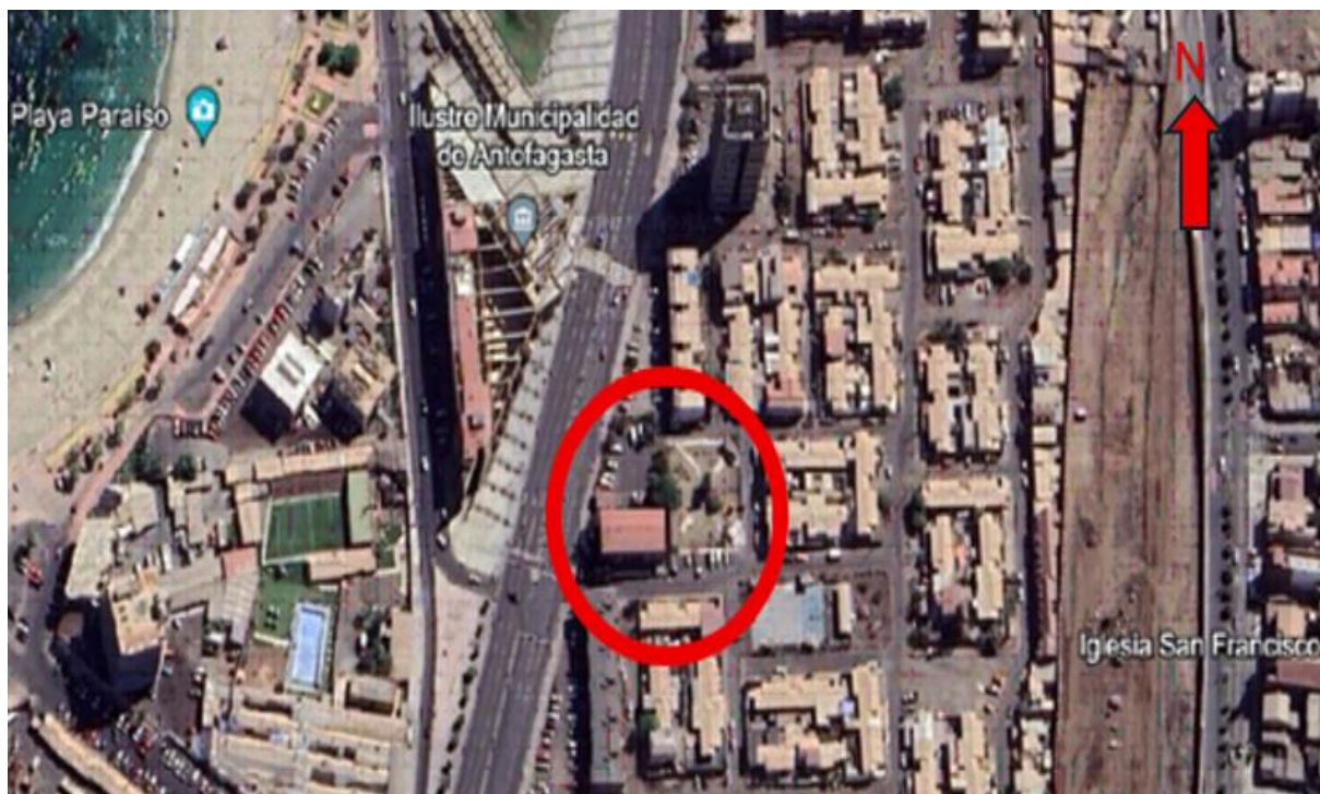
Fig. N°1: Emplazamiento Ex Edificio SERVIU Región de Antofagasta