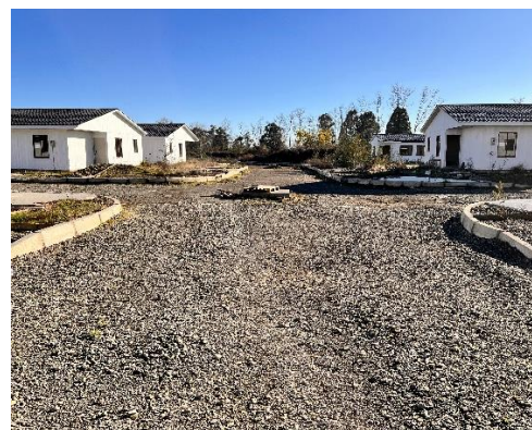
Figura N°3, imagen actualizada de las viviendas con fecha 08 agosto 2025

Cabe señalar, que las obras se ejecutaron mediante resolución de aprobación de loteo DFL 2 con construcción simultánea N°01 de fecha 13 de noviembre de 2020 y Permiso de Edificación N°100 del 13 de noviembre de 2020 y permiso de edificación N°102 de fecha 13 de noviembre del 2020 otorgados por la Dirección de Obras de la Municipalidad de San Ignacio.