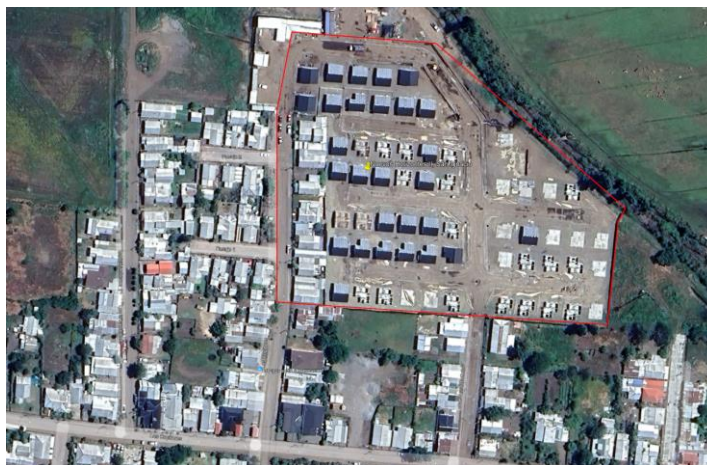
Figura N°1, emplazamiento de lotes del proyecto habitacional

De igual manera, se evaluará el estado actual de las construcciones, identificando posibles deterioros por exposición a la intemperie durante el tiempo de paralización y/o defectos de ejecución, y se emitirán recomendaciones respecto a demolición, reparación y/o refuerzo cuando el análisis así lo aconseje; y definir de manera clara mediante presupuesto de obras por recontractar, los recursos económicos que faltan para dar término al proyecto habitacional.