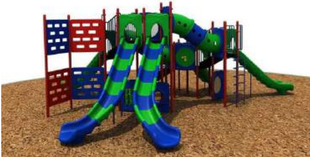
Img. Referencial Juego Modular

Posterior al retiro, se contempla la provisión e instalación de juego modular de alto tráfico Tipo Play Plaza (juego Modular 48 – HBQQ48) o similar.