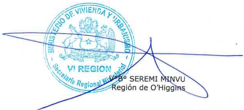
B° SEREMI MINVU Región de O'Higgins