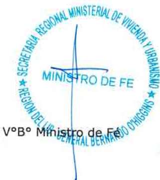
V°B° Ministro de Fe