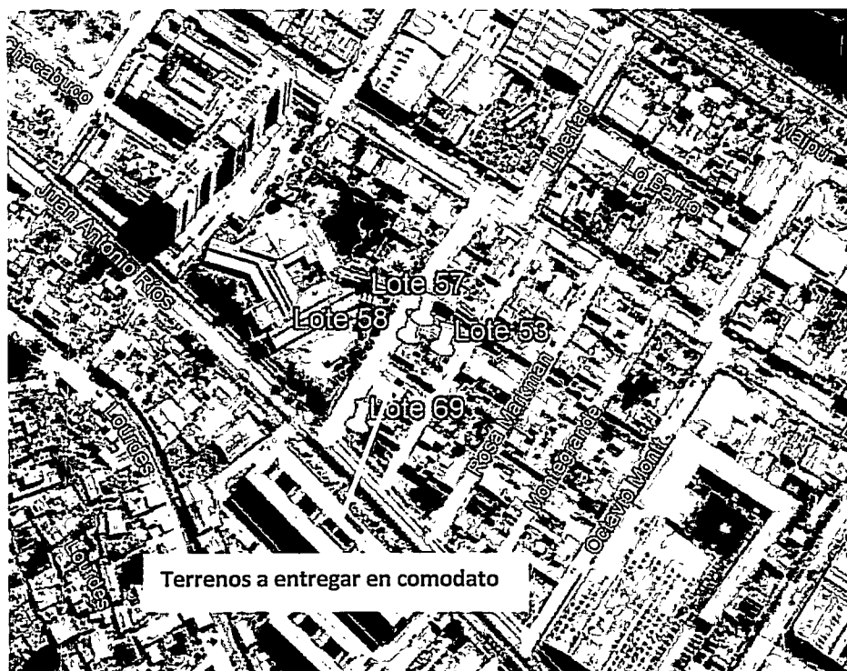
Figura 1: Imagen Satelital del emplazamiento de los inmuebles