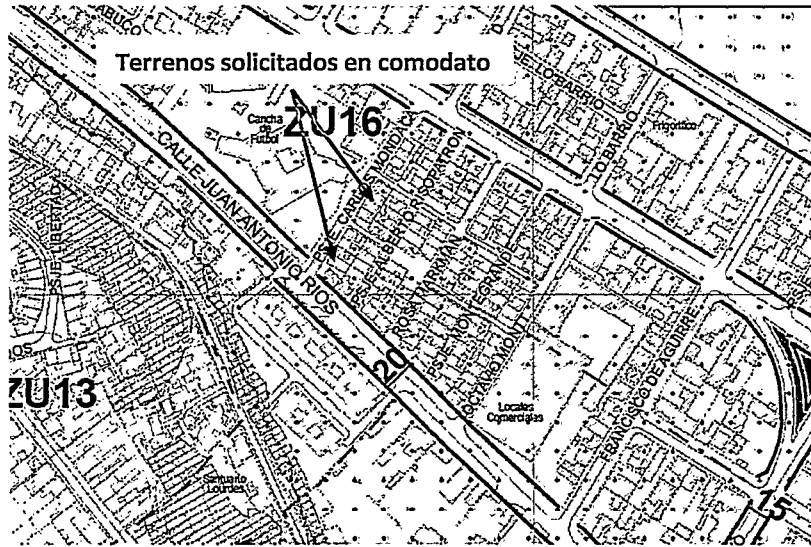
Figura 2: Emplazamiento de la parte de los predios solicitados en comodato respecto del P.R.C. de Coquimbo vigente.

De acuerdo con los antecedentes adjuntos a la presentación, los predios en consulta, emplazados en los Lotes 53, 57, 58 y 69, Sector de Baquedano, comuna de Coquimbo, se emplazan en la totalidad de su superficie dentro del área urbana del Plan Regulador Comunal vigente de Coquimbo (Diario Oficial del 10.07.2019), específicamente en la Zona Urbana Mixta Residencial 16 (ZU16).