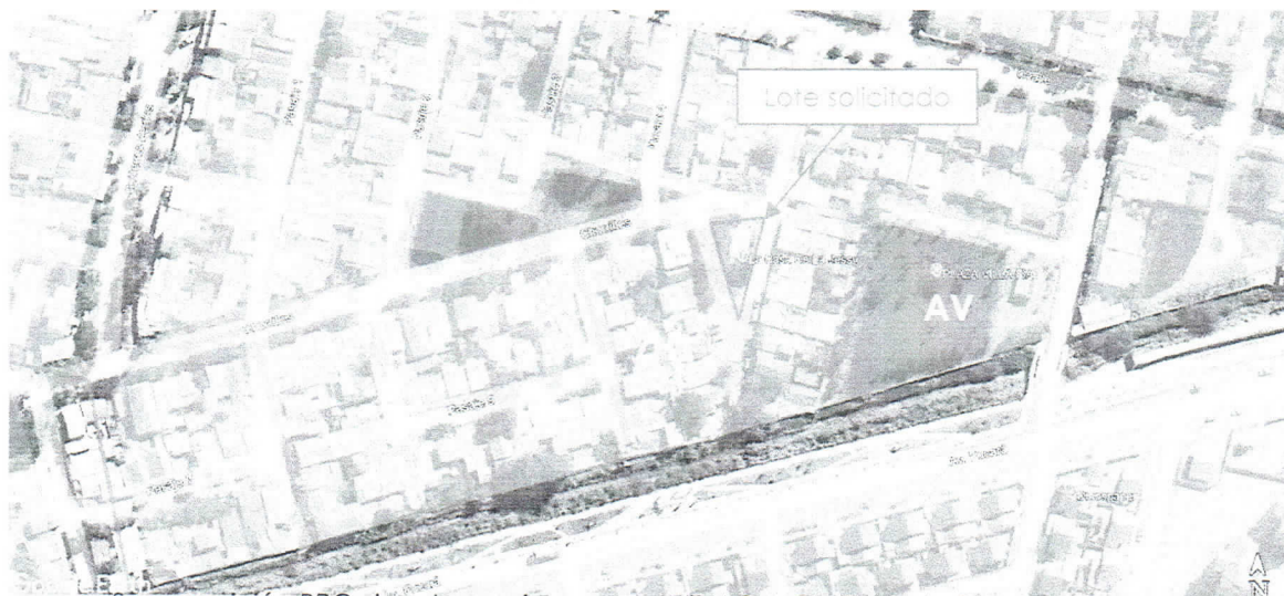
Superposición PRC vigente con imagen satelital Google Earth de fecha 21.03.2024.

Sumado a lo expuesto tanto de la información emitida por SERVIU como de la revisión del caso por esta Seremi Minvu, se visualiza que la imagen satelital y la del plano PRCGRA-06106, en la sobreposición de ambos se constata que el lote solicitado se gráfica en "ZH1" Zona Habitacional Densidad Alta del PRC vigente. Además, es posible verificar que dicho lote en la imagen satelital su polígono varía del Plano de loteo n°255 archivado al final de registro de Propiedades del año 1982 de la "Población José Joaquín Flores" . ✓