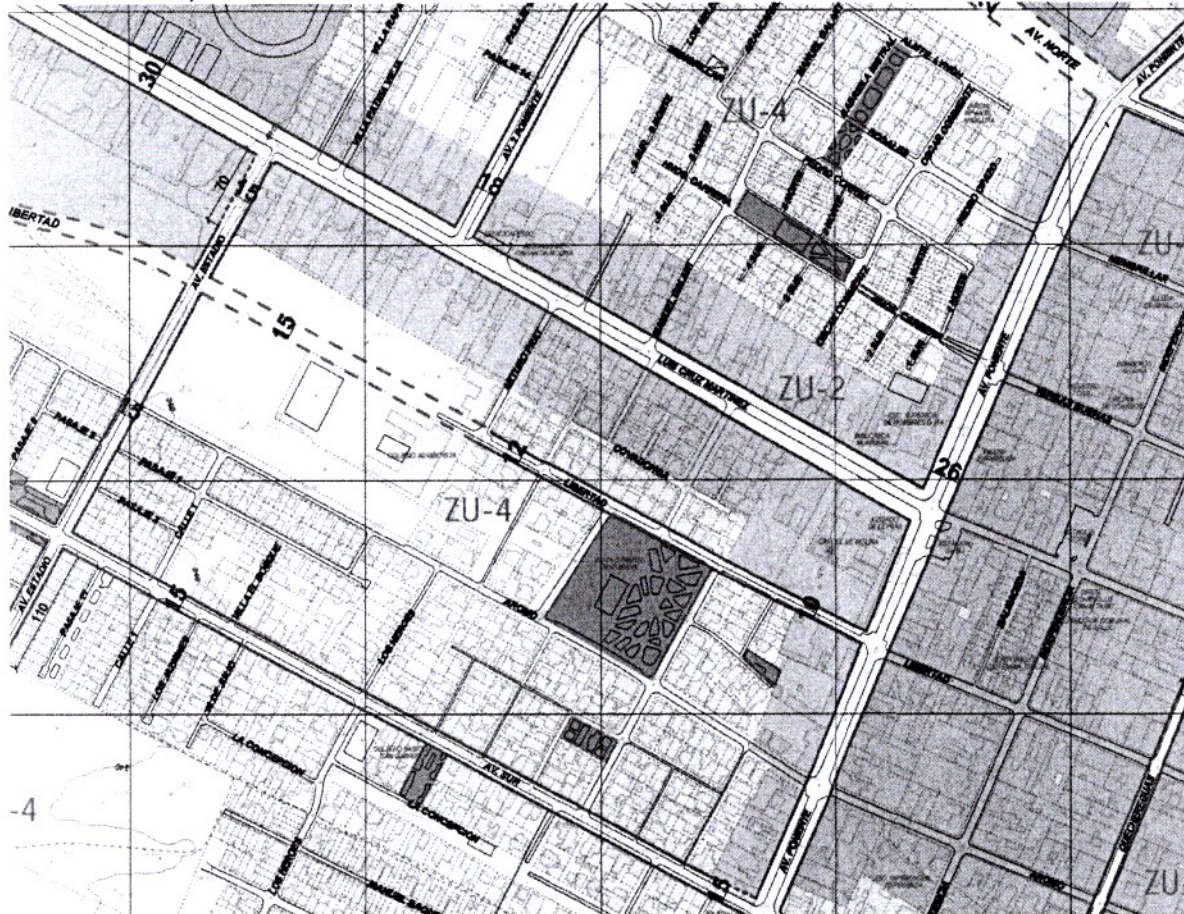
Figura 4: Graficación de la Avenida Luis Cruz Martínez en el Plano del PRC de Molina, en el tramo entre la Avenida Estadio y la Avenida Poniente.

Fuente: Extracto del Plano del PRC de Molina