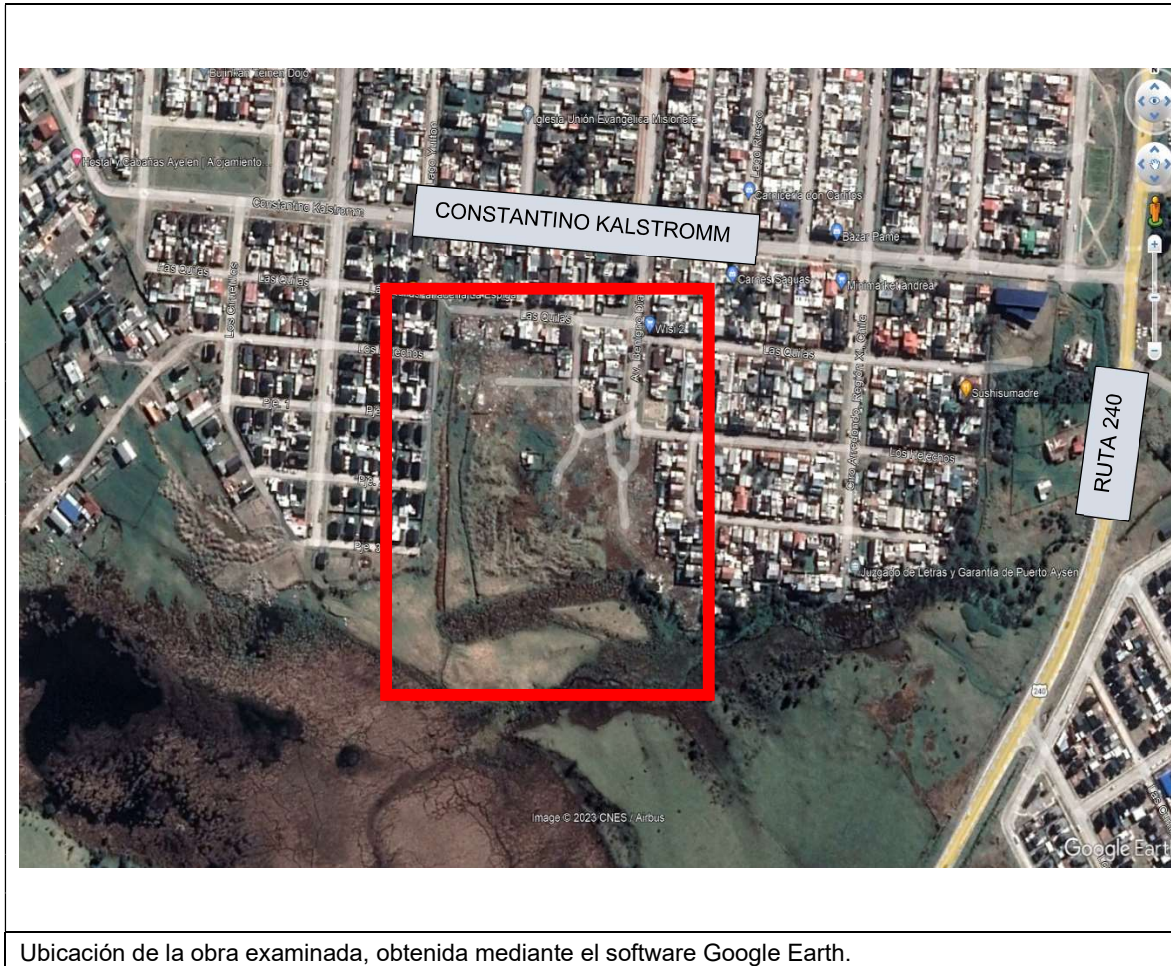
Ubicación de la obra examinada, obtenida mediante el software Google Earth.