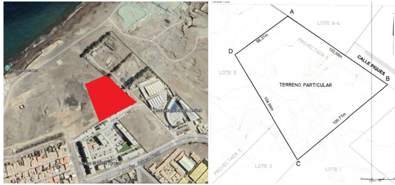
3. Proyecto Esquina Prat Baquedano, sector centro de la ciudad de Tocopilla