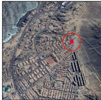
CROQUIS DE UBICACIÓN S/E