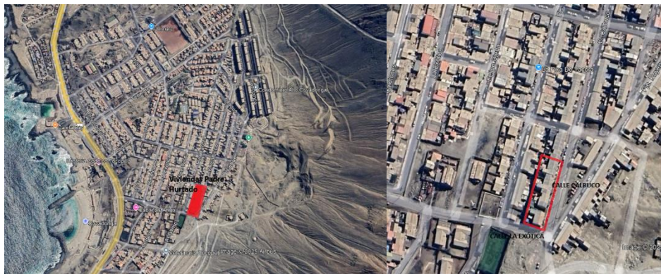
Ubicación Viviendas Padre Hurtado

De acuerdo a lo indica la resolución en comento, se está realizando en forma interna la entrega de información por parte del Departamento de Operaciones Habitacionales, Departamento Jurídico, Departamento Técnico a través de las Unidades de Gestión de Suelo y de Proyectos y Costos.