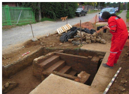
Imágenes 1: Rasgo Escalera UEX1, sector de Calle Los Pelúes en la Isla Teja.