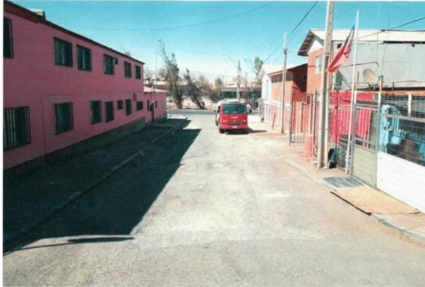
Foto estado encontrado por la empresa: Se aprecia la carencia de asfalto, lo que hace necesario implementar la solución completa del paquete estructural de calzada.

Dada la inexistencia de pavimento para poder aplicar el proceso de fresado y recapado, se hace necesario implementar el paquete estructural de calzada de asfalto completo.