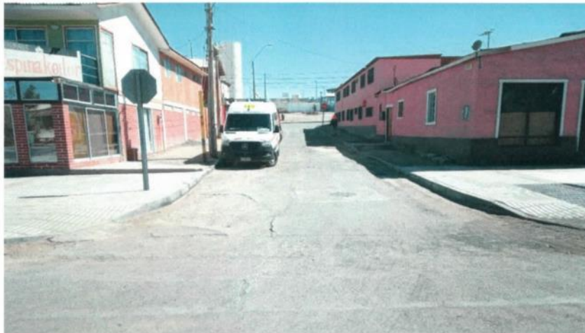
Foto asesoría: Se aprecia la existencia de asfalto en mal estado, por lo tanto, se consideró su conservación.

Esta vía, si bien se encuentra dentro del levantamiento original y está considerada su conservación, al momento de ingresar la empresa para realizar el replanteo de rigor, se detectó que este tramo carecía de asfalto. Esto se debió a una intervención inconclusa de la empresa Aguas Antofagasta S.A. según fue confirmado por la municipalidad de Sierra Gorda.