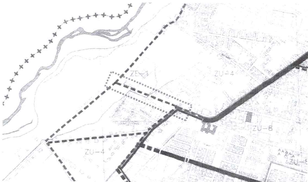
Detalle del plano del Plan Regulador Comunal San Fernando.