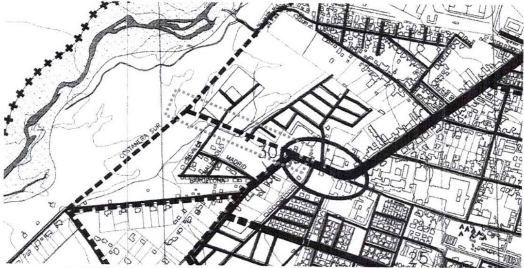
Detalle del plano PRSF-2 Vialidad Estructurante del Plan Regulador Comunal San Fernando.