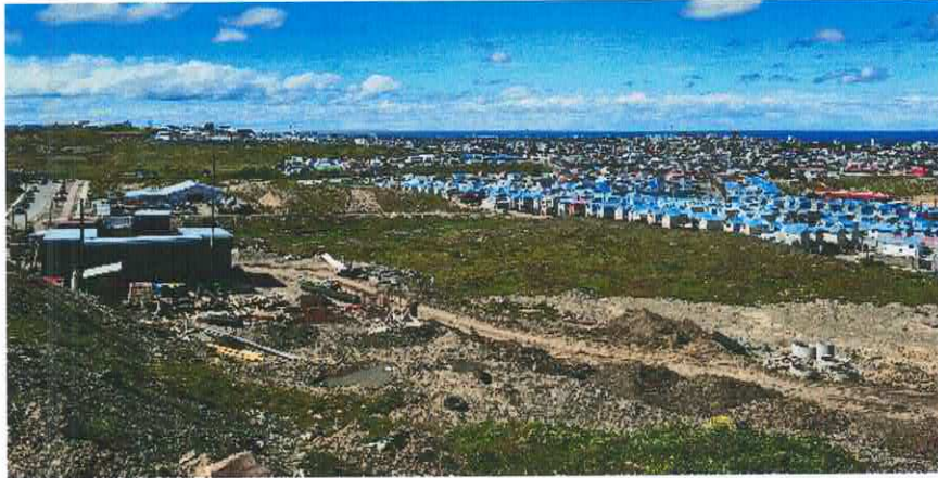
Visita a Terreno PUH Ciudad de los Vientos.