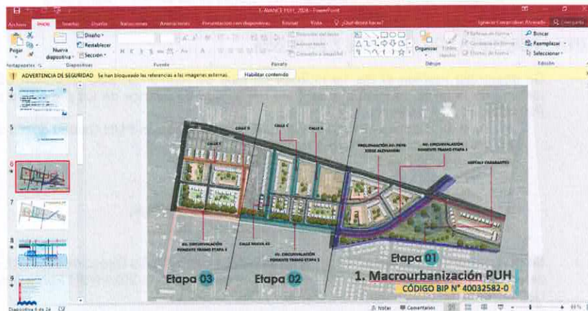
Lámina N°6 – Macrouurbanización PUH elaborada.