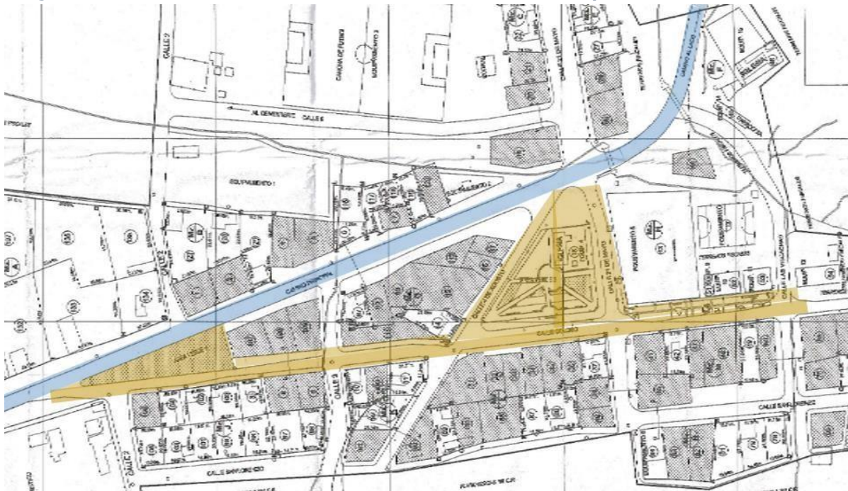
Imagen 2. Zoom del Pueblo de Socaire destacado ruta CH-23 en azul y área a intervenir en ocre.