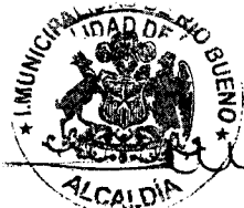
LUIS REYES ÁLVAREZ Alcalde Ilustre Municipalidad de Río Bueno