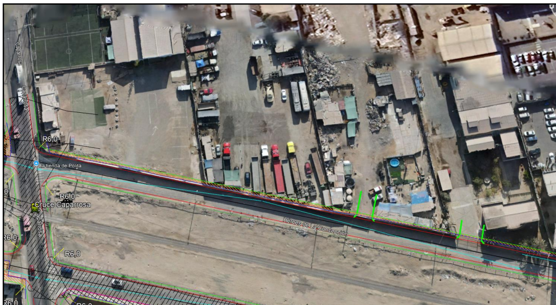
Imagen 2. Imagen satelital con diseño geométrico del proyecto

Actualmente, los lotes están ocupados por empresas por lo que se puede observar.