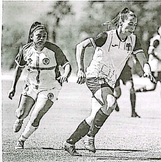
Las rancagüinas jugarán este viernes en el Monasterio Celeste frente a Deportes Santa Cruz.

Este viernes, al mediodía, O'Higgins de Rancagua tendrá la opción de sumar nuevos tres puntos en el grupo sur del Ascenso Femenino pues, en casa, recibirá a Deportes Santa Cruz. Las celestes, que en la última fecha derrotaron a Rangers en Talca, buscarán los tres puntos para sostenerse entre las líderes de la zona, ya que comparten la cima junto a Nublense y Deportes Puerto Montt, con 14 unidades. Las unionistas, en tanto, acumulan solo 2 puntos producto de igualdades justamente frente a O'Higgins -en Pichidegua- y ante Curicó Unido. En esta fecha, la 9 de la fase grupal, registrará también los siguientes lances: Nublense vs Rangers, y; Deportes Concepción vs Curicó Unido. Cabe consignar que, en la jornada 10, las dirigidas por Manuel Alarcón no verán acción ya que tendrán que cumplir con su segunda fecha libre. 📷