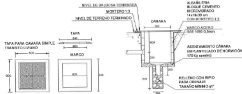
Figura N° 12: Detalle Constructivo Cámara Subterránea de Baja Tensión

A continuación, se presenta de forma referencial el plano de detalles de las cámaras descritas, incluido en los planos de proyecto de iluminación.