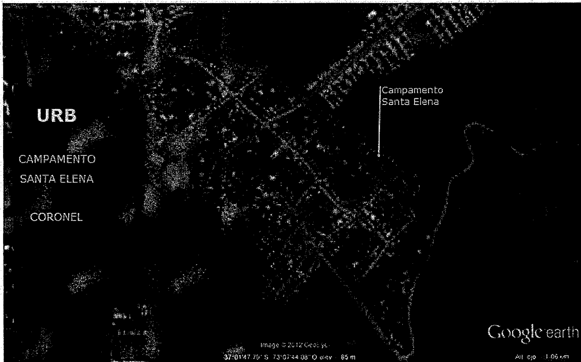
Imagen 1: Polígono de estudio.

En consecuencia, atendido el común interés de la SEREMI y de la MUNICIPALIDAD por desarrollar las actividades señaladas en el párrafo antecedente; y considerando que el presupuesto del MINVU, Programa de Aldeas y Campamentos, contempla la posibilidad de transferencias de capital a otras entidades públicas, específicamente a Municipalidades (subtítulo 33 ítem 03 asignación 003 del presupuesto vigente), se estima necesaria la celebración de un convenio de ejecución y transferencia de recursos, en virtud del cual, la MUNICIPALIDAD podrá disponer de los fondos necesarios para financiar el proyecto denominado “DISEÑO URBANIZACIÓN CAMPAMENTO SANTA ELENA, COMUNA DE CORONEL” .