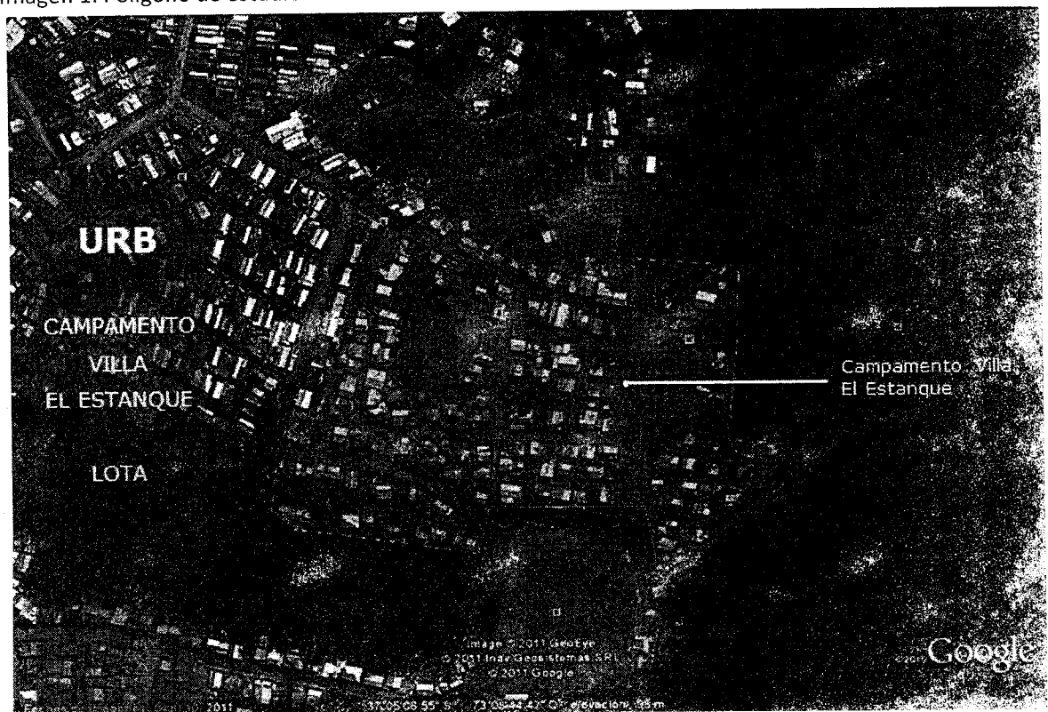
Imagen 1: Polígono de estudio.

Para ello, y con objeto de viabilizar el proyecto de radicación de las familias del campamento señalado, se ha estimado indispensable contar con un estudio del sector a intervenir que aporte la información necesaria para definir desde el punto de vista técnico y legal, la posibilidad de ejecutar dicho proyecto, especialmente respecto a la factibilidad de servicios básicos.