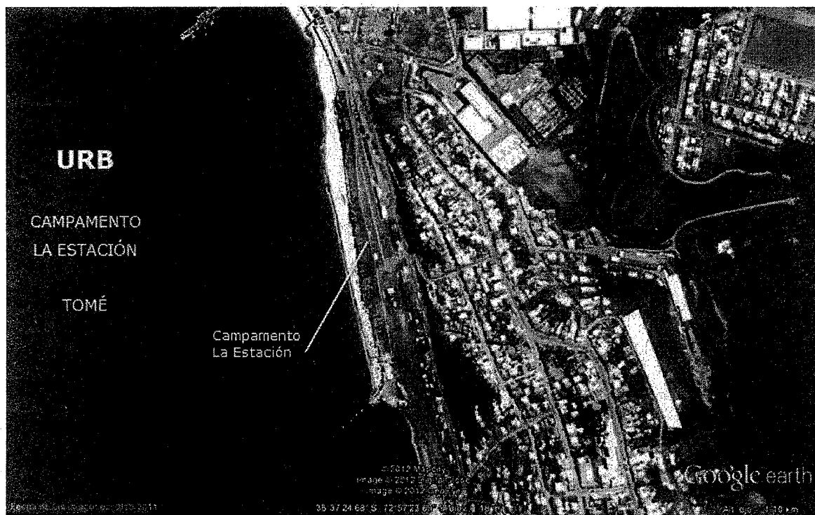
Imagen 1: Polígono de estudio.

En consecuencia, atendido el común interés de la SEREMI y de la MUNICIPALIDAD por desarrollar las actividades señaladas en el párrafo antecedente; y considerando que el