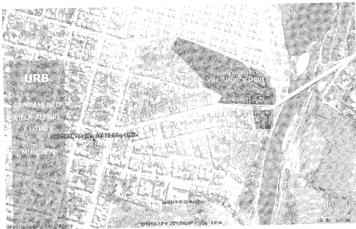
Imagen 1: Polígono de estudio.

En consecuencia, atendido el común interés de la SEREMI y de la MUNICIPALIDAD por desarrollar las actividades señaladas en el párrafo antecedente; y considerando que el presupuesto del MINVU, Programa de Aldeas y Campamentos, contempla la posibilidad de transferencias de capital a otras entidades públicas, específicamente a Municipalidades (subtítulo 33 ítem 03 asignación 003 del presupuesto vigente), se estima necesaria la celebración de un convenio de ejecución y transferencia de recursos, en virtud del cual, la MUNICIPALIDAD podrá disponer de los fondos necesarios para financiar el proyecto denominado "ACTUALIZACIÓN DISEÑO URBANIZACIÓN CAMPAMENTO VILLA ALEGRE Y OTROS, COMUNA DE MULCHÉN" .