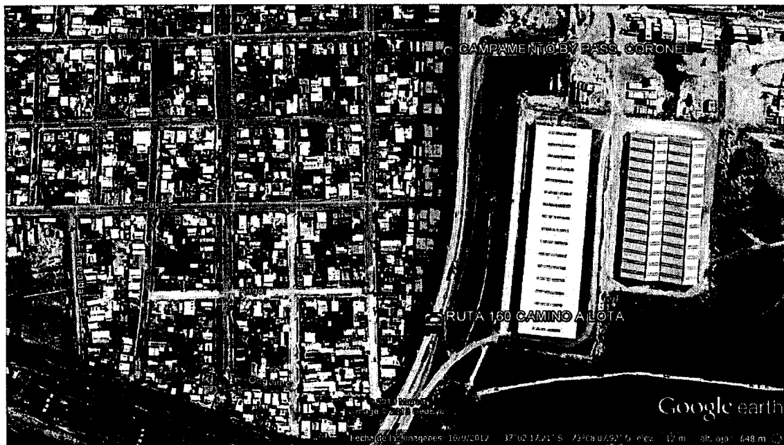
Imagen 1: Polígono de estudio.

En consecuencia, atendido el común interés de la SEREMI y de la MUNICIPALIDAD por desarrollar las actividades señaladas en el párrafo antecedente; y considerando que el presupuesto del MINVU, Programa de Aldeas y Campamentos, contempla la posibilidad de transferencias de capital a otras entidades públicas, específicamente a Municipalidades (subtítulo 33 ítem 03 asignación 003 del presupuesto vigente), se estima necesaria la celebración de un convenio de ejecución y transferencia de recursos, en virtud del cual, la MUNICIPALIDAD podrá disponer de los fondos necesarios para financiar el proyecto denominado “CONSTRUCCIÓN RED AGUA POTABLE Y ALCANTARILLADO CAMPAMENTO BY PASS, COMUNA DE CORONEL” .