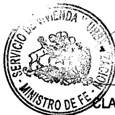
CLAUDIO CASTILLO AGUIRRE MINISTRO DE FE