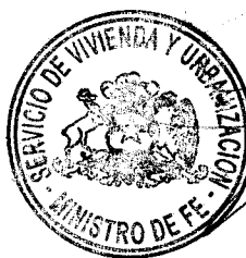
CLAUDIO CASTILLO AGUIRRE MINISTRO DE FE