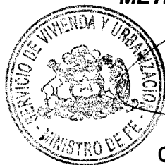
CLAUDIO CASTILLO AGUIRRE MINISTRO DE FE