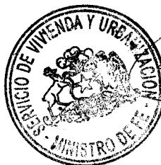
CLAUDIO CASTILLO AGUIRRE MINISTRO DE FE