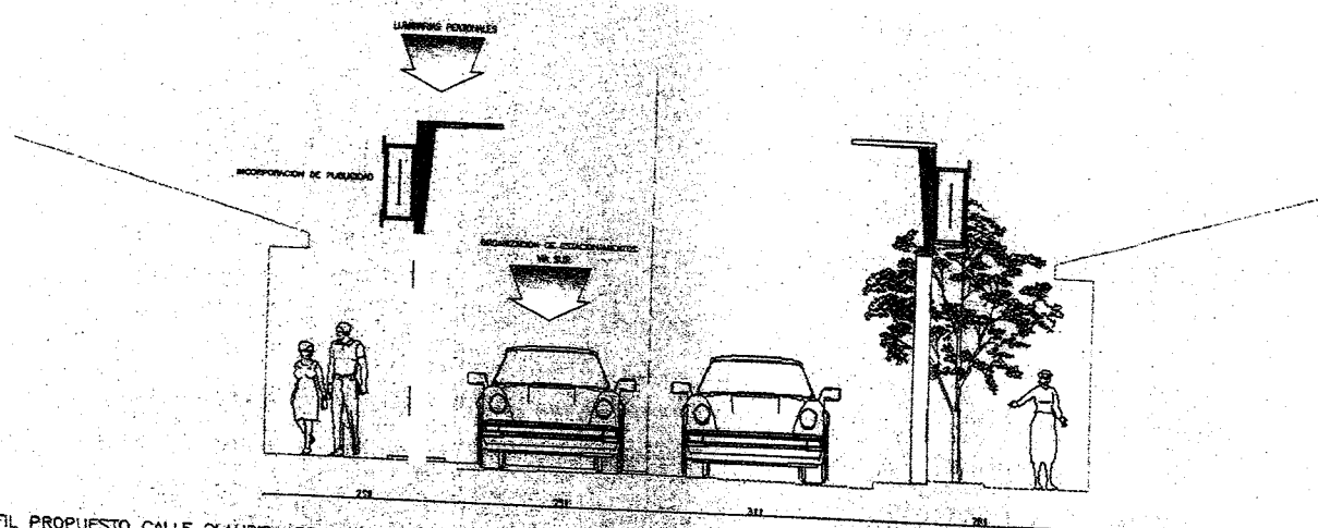
ERFIL PROPUESTO CALLE CLAUDIO ARRAU