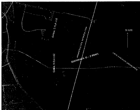
Figura Ilustrativa Base Google Earth 2004

Estudio, que no cumplirían los requerimientos informados por el Departamento de Obras Fluviales.