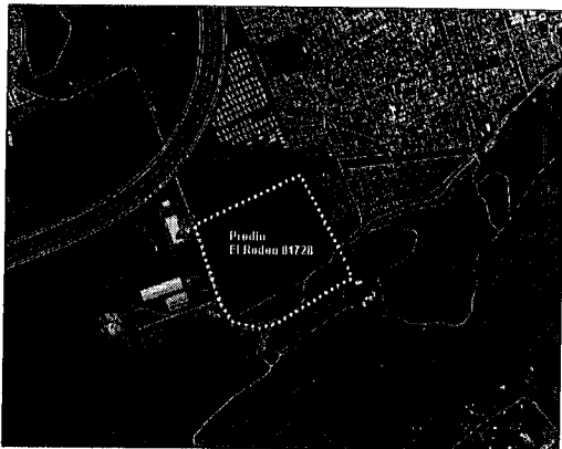
ESQUEMA N°1. Localización en Google Earth