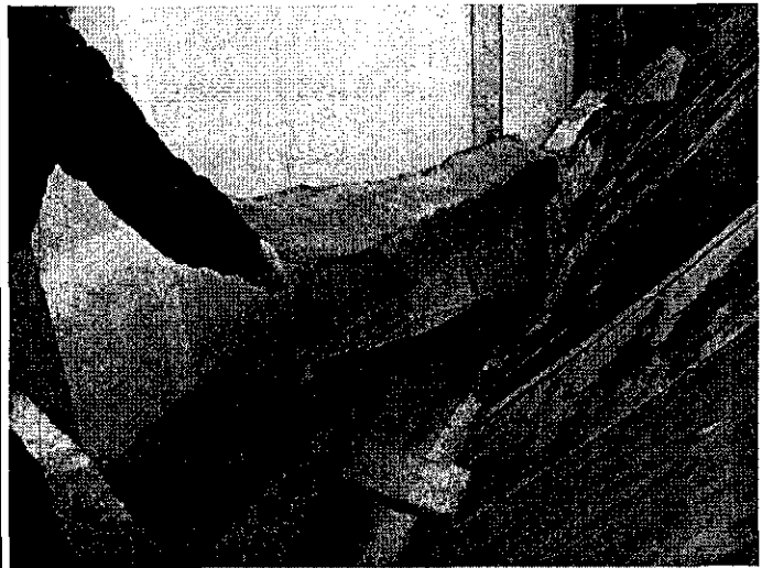
Fotografía 2: Hojalatería de carácter provisorio en el sector deslinde.