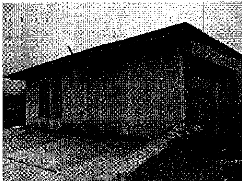
Fotografía 3: Retranqueo muro y A. lluvias hacia el oriente

En este mismo muro se observa además un retranqueo del mismo con respecto al deslinde.