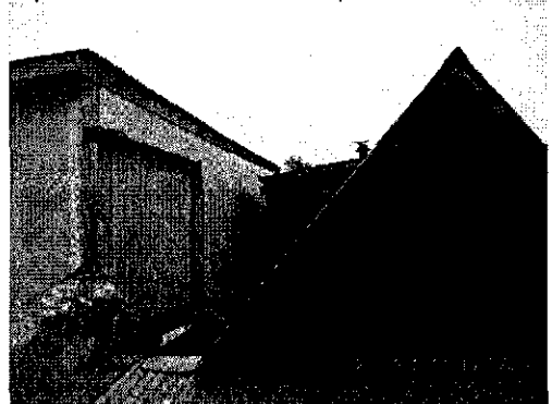
Fotografía 4: Zona deslinde