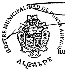
EMILIO BOCCAZZI CAMPOS ALCALDE ILUSTRE MUNICIPALIDAD DE PUNTA ARENAS