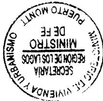
ILSE URRUTIA TRAUTMANN MINISTRO DE FE

Lo que transcribo a Usted para su conocimiento