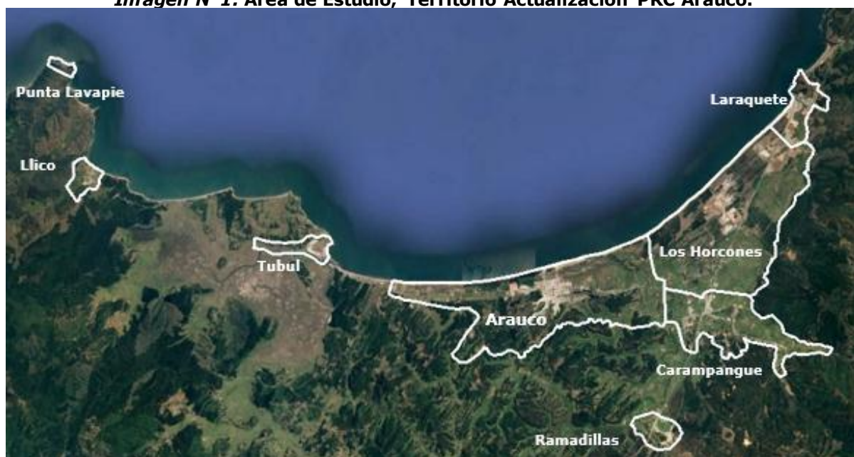
Imagen N°1. Área de Estudio, Territorio Actualización PRC Arauco.