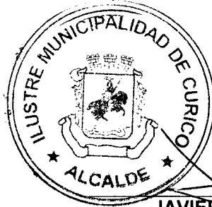
JAVIER MUÑOZ RIQUELME ALCALDE ILUSTRE MUNICIPALIDAD DE CURICO