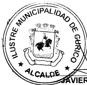
JAVIER MUÑOZ RIQUELME ALCALDE ILUSTRE MUNICIPALIDAD DE CURICO