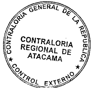
ESTEBAN MIRANDA PEÑA JEFE DE CONTROL EXTERNO (S)