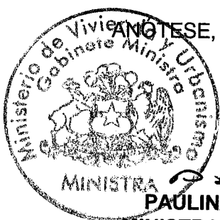
PAULINA SABALL ASTABURUAGA MINISTRA DE VIVIENDA Y URBANISMO