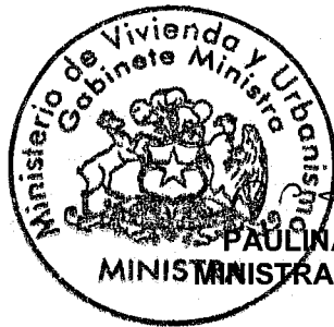
PAULINA SABALL ASTABURUAGA MINISTRA DE VIVIENDA Y URBANISMO