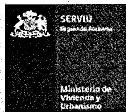
Tabla Referencial de Precios Unitarios PPPF 2015 LISTADO PRECIOS UNITARIOS OBRA GRUESA