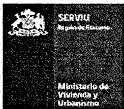
Tabla Referencial de Precios Unitarios PPPF 2015 LISTADO PRECIOS UNITARIOS OBRAS DE INSTALACIONES