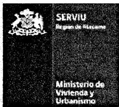
Tabla Referencial de Precios Unitarios PPPF 2015