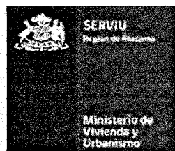
Tabla Referencial de Precios Unitarios PPPF 2015 LISTADO PRECIOS UNITARIOS OBRAS DE HABILITACIÓN